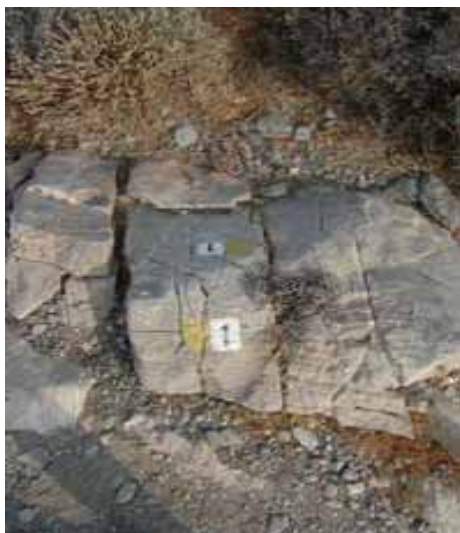
Segnalazioni in bianco e giallo