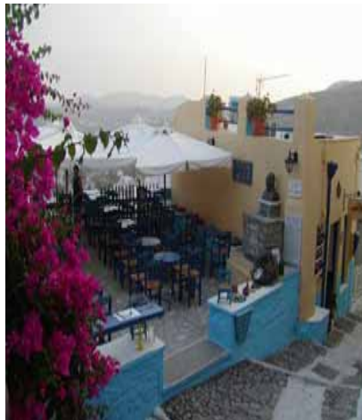
Il piccolo bar di Ano Syros