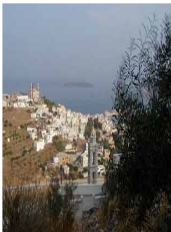
Vista da Ano Syros: cattedrale cattolica e quella ortodossa

L'arrivo è impressionante. Una cascata di case neoclassiche che scendono dalle due colline. Guardando la città dal mare, ANO SYROS , (nella foto) l'enclave cattolica romana fondata dai veneziani, scende dalla collina di destra, mentre da quella di sinistra, le case di VRONTADO , caposaldo ortodosso, finiscono per confondersi con quelle di Ermoupoli. Proprio di fronte al molo di sbarco, il Casinò delle Cicladi ti dà il primo ammiccante benvenuto, a seguire le agenzie turistiche, bar, fast food. Subito dietro il lungomare, la piazza Miaouli, (nella foto) disegnata nel 1898 dall'architetto Ziller, è dominata dallo splendido Municipio neoclassico.