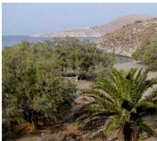
Nella prima foto la spiaggia prima di Grammata

Con l'auto o il motorino si raggiunge senza difficoltà la località di Kambos dove finisce la strada e cominciano i sentieri per le spiagge di Marmari e del Golfo di Grammata e per la punta estrema di Diaporti. I sentieri sono contrassegnati dai numeri 1 per il Golfo di Grammata, 2 per la Spiaggia di Marmari e 5 per Diaporti.