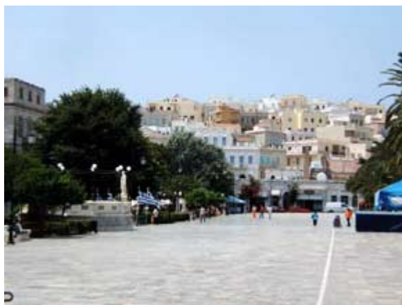
Platia Miaouli