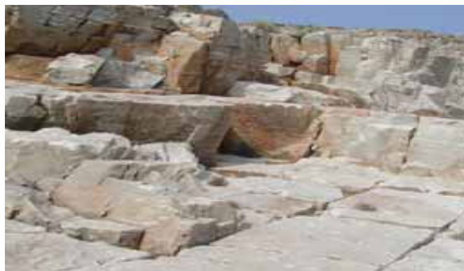
Grammata, dove dovrebbero esserci le incisioni

Sono tutti ben segnati in bianco e giallo (vedi foto a sinistra). Non si può sbagliare.