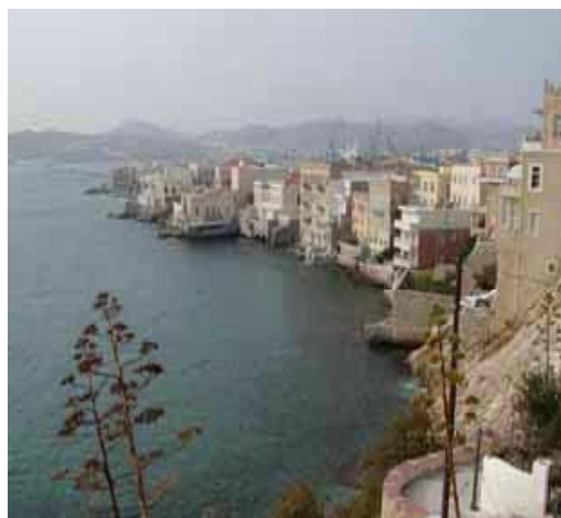
Il quartiere veneziano (Vaporía)