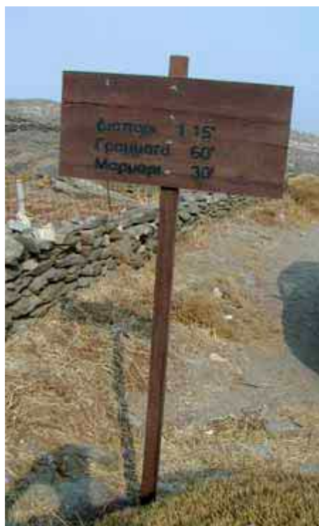
Cartello a Kambos con tempi