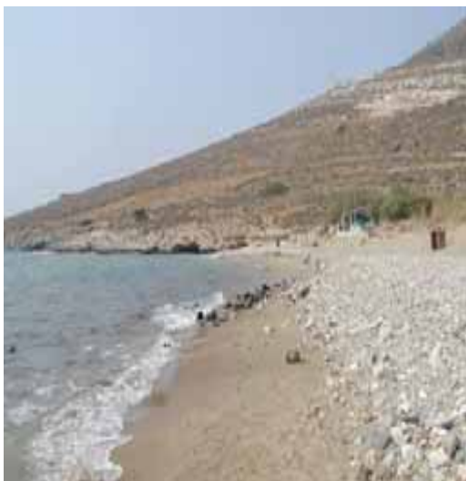
Baia di delfini