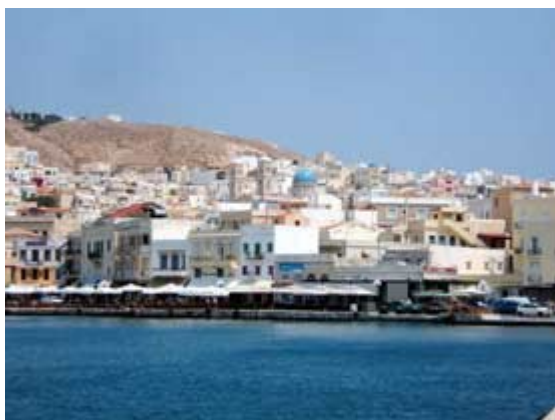
Vista di Ermoupoli

La parte centro sud dell'isola è dedita all'agricoltura e al turismo balneare. Le spiagge dei villaggi turistici, a breve distanza dalla capitale, presentano un mare pulito, ombre piacevoli, non sono molto affollate, ma nessuna è destinata a rimanere nei nostri sogni. Abbiamo notato una discreta presenza di turismo internazionale in quei centri balneari dove è possibile un tranquillo e rilassante mare-spiaggia. La parte più verde e affascinante è il nord dell'isola. Dopo Ano Syros inizia un'altra isola, ruspante e ancora selvaggia, dove il sentiero toglie il primato all'asfalto. ma è anche la parte più scomoda e mal servita.