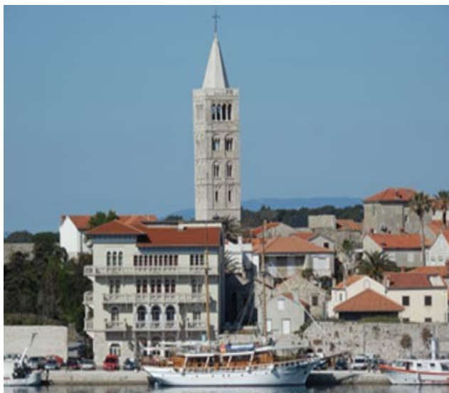
Rab: il campanile della diocesi

Si raggiunge, ora, dal nuovo porto di Stinica (...in precedenza da Jablanac) in circa 10 minuti arrivando in una zona sassosa e senza vegetazione: suggestiva se si raggiunge al contrario per prendere il traghetto.