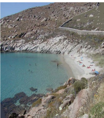
La bella spiaggia di Kapari