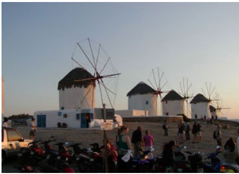
Mulini a vento al tramonto