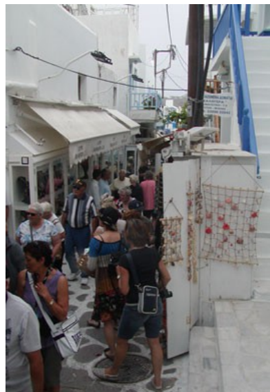
Invasione dei croceristi (16 maggio)