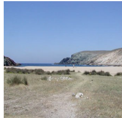
Fokos da non perdere (anche per il ristorante nel retro).