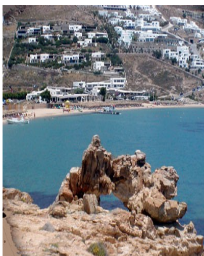
La spiaggia di Elia dal sentiero per Agrari