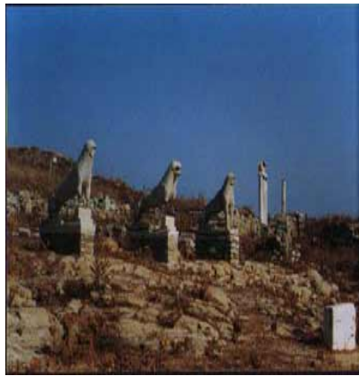
Delos: i leoni