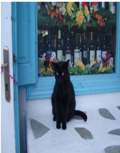
Il gatto di Mikonos, fotografato un po' meno del pellicano

La rete stradale è notevolmente aumentata e pertanto i collegamenti sono stati resi più facile. Con le strade la cementificazione dell'isola è continuata: intorno e fuori la Chora. I nuovi quartieri, adibiti prevalentemente alla ricettività turistica, si sono riempiti di nuove strutture e altre ancora sono in costruzione nei pochi pezzi di terreno rimasti liberi. I primi a lamentarsi per l'eccessivo sviluppo dell'offerta sono gli stessi albergatori e affittacamere che cominciano ad avere difficoltà a riempire i posti letto. Risentono della dura legge della competitività, strumento devastante e principale della globalizzazione. Ultima nota dolente: sono sparite le capre e gli asini. Alla Chora è rimasto un bel gatto pasciuto e il pellicano.