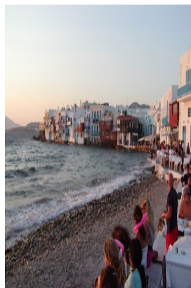
Venetia al tramonto