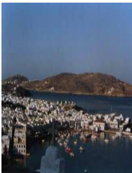
Veduta di Mikonos

I Ghisi costruirono il Kastro difensivo, nella parte più alta della Chora, in prossimità della Paraportiani , la più famosa e fotografata per la sua straordinaria conformazione architettonica delle circa 400 chiese dell'isola. Questa è la parte più vecchia della Chora che termina nel caratteristico porticciolo dei pescatori dove si incontra uno dei simboli dell'isola, Petros, il pellicano, strafotografato dai turisti. Una volta il pellicano si trovava solo a Mikonos, ora pare sia diventato di moda, lo abbiamo visto anche in altre isole.