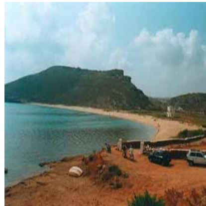
La spiaggia di Panormos