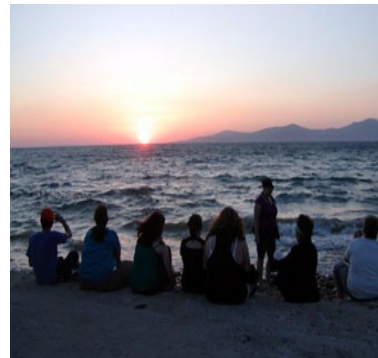
Ultimo raggio di sole

Il villaggio rimane splendido, passeggiando per le sue caratteristiche viuzze, si scoprono una miriade di candide chiesette dai cupoloni bianchi, azzurri e blu che si uniscono alle case e ai piccoli negozi turistici per formare un incredibile e affascinante dedalo. Altro punto caratteristico è il vecchio quartiere d'Alefkandra , ribattezzato Venetia, con le case degli antichi pirati miconiati, bagnate dalle onde. Qui i turisti vengono a godersi il tramonto, sorseggiando un aperitivo, in uno dei locali fronte mare dove gli spruzzi qualche volta arrivano ai tavoli.