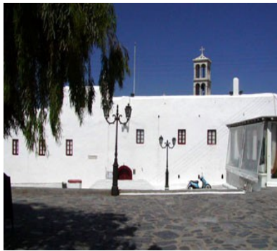
Monastero Torliani ad Ano Mera