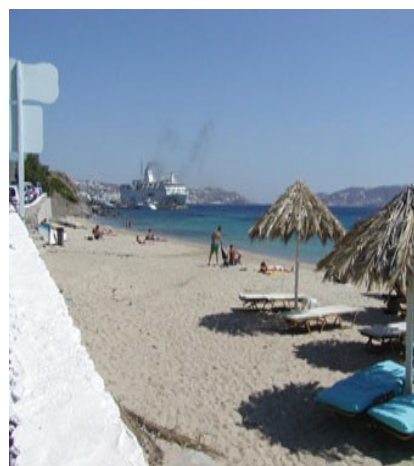
Ag. Stefanos, sullo sfondo il porto