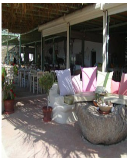
Ristorante Lia Bay