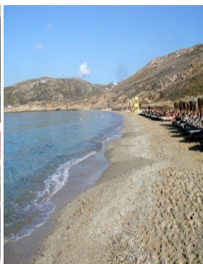
Spiaggia di Elia - giugno 2013 - fila interminabile di lettini e ombrelloni, quasi tutti vuoti