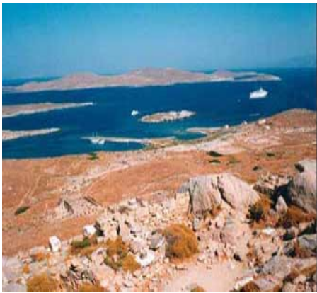
Delos: foto di Gaio